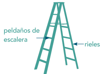
Conexiones y fijaciones