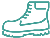
Zapatos de seguridad